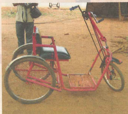
Das Tricycle wurde von einem ehemaligen Auszubildenden hergestellt.

■ Der Verein wurde 1988 aus einem Arbeitskreis der Landjugend gegründet und hat über 125 Mitglieder. Weitere Infos findet Ihr unter: www.ghana-ev.de